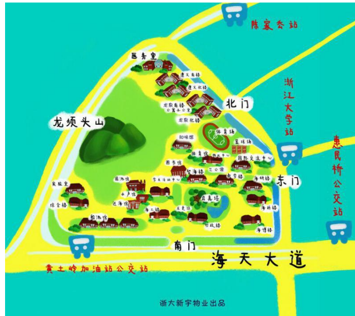
浙江大学舟山校区校内地图：